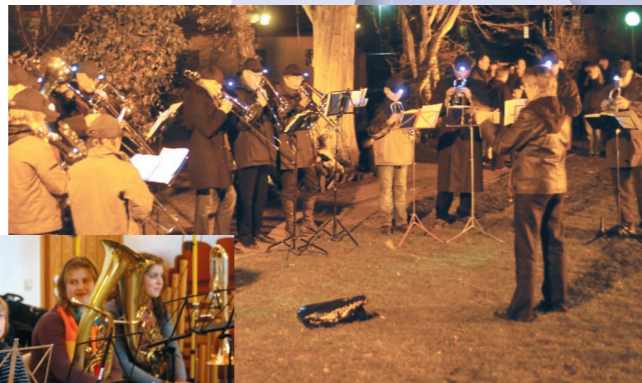
Nächtliches Spiel auf der Osterausinsel am Osterfeuer zu Beginn der Osternacht. Sonnabend, 3. April 2010

Auf der Maschmann'schen Wiese in der Schulstraße, Hitzhusen 13. Juni 2011