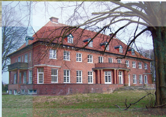
Die Villa Sager